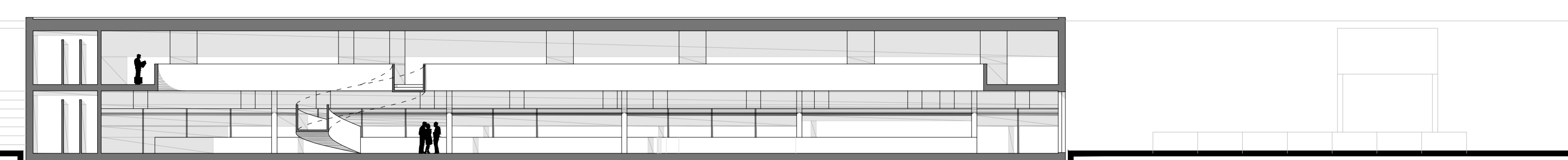
SEZIONE LONGITUDINALE 1.200